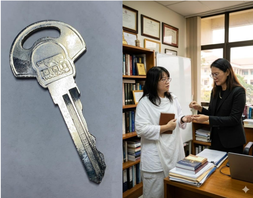
ภาพที่ 2 กุญแจที่ถูกส่งทางไลน์พร้อมข้อความประกอบภาพ อันเป็นที่มาของชื่อบทความ

จากภาพ 1-2 ทั้งสองเหตุการณ์เป็นเนื้อเรื่องด้วย “กุญแจ” ในบทความนี้จึงถูกสร้างมาจากคำอธิบายร่วมของ 2 เหตุการณ์นั้น โดยใช้มุมมอง หากคิดบวก กุญแจ ก็เป็นเครื่องมือ หากตรงกันข้าม กุญแจ ก็กลายเป็น “อุปสรรค” สำหรับการใช้ชีวิต และทำให้การใช้ชีวิตเปลี่ยนไปทันที ดังนั้นการมอบกุญแจ การถือกุญแจ และการใช้กุญแจ จึงเป็นหน้าที่ของตัวเจ้าของเอง ที่จะต้อง (๑) ปกป้องสิ่งที่แสวงหาด้วยการนำกุญแจมาปกป้องรักษาไว้ หรือ (๒) ไขสิ่งที่อยู่ด้านในมาเป็นสิ่งสนับสนุนเครื่องมือในการดำเนินชีวิต ดังนั้น กุญแจ จึงเป็นทั้ง ปกป้อง รักษา พิทักษ์ หรือการปล่อยออก คลายออก ในมิตินี้กุญแจจึงเป็นทั้ง “คุณ” และ “โทษ” แต่อยู่ที่วิธีการใช้ หรือการนำไปใช้นั่นเอง