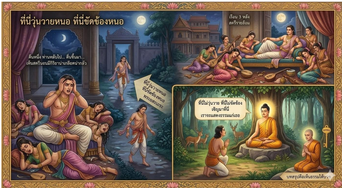
ภาพที่ 4 นายยสะ ผู้ใช้ความวุ่นวาย เป็นเครื่องมือสู่การแสวงหาความไม่วุ่นวาย (ภาพจำลองจาก AI, 9 มีนาคม 2569)

กรณีที่ 3 กุญแจไขสัจจะว่าด้วย ตาย และไม่ตาย ที่ธรรมชาติ ใคร ๆ ก็ต้องตาย เมล็ดพันธุ์ผักกาดแห่งชีวิต พระกีสาคโคตมีเถรี (ขุ.วิ. (ไทย) 26/220-223/591) เดิมเกิดในสกุลคนเชื้อใจ ในกรุงสาวัตถี ครั้งหนึ่ง เศรษฐีตระกูลหนึ่งในเมืองสาวัตถีประสบเคราะห์กรรมคือเงินและทองกลายเป็นถ่าน แต่เมื่อนางกีสาคโคตมีมาแตะถ่านเหล่านั้น ถ่านก็กลับกลายเป็นเงินและทองอย่างเดิม เศรษฐีจึงสว่ขอท่านมาเป็นลูกสะใภ้ แต่ก็ไม่วายที่จะถูกคนเหล่านั้นเหยียดหยามว่ามาจากตระกูลคนยากจน ต่อมานางจึงให้กำเนิดบุตรแต่บุตรนั้นก็ได้ตายจากไป เมื่ออายุเพียง 3 ขวบ การตายของบุตรจึงทำให้นางตกอยู่ในความทุกข์อย่างหนัก ถึงขนาดอุ้มศพลูกไปทุกหนทุกแห่ง จนกระทั่งมาพบพระพุทธเจ้าขณะประทับอยู่ ณ วัดเชตวัน เมืองสาวัตถี พระพุทธองค์ทรงแนะนำอุบายคลายความทุกข์โดยการให้นางไปเสาะหาเมล็ดพันธุ์ผักกาดจากบ้านที่ไม่เคยมีคนตาย ปรากฏว่านางต้องผิดหวัง เพราะบ้านทุกหลัง ล้วนแต่มีคนตายทั้งสิ้น ในที่สุดนางจึงได้ซื้อสรุปว่า ความตายเป็นเรื่องธรรมดาของคนหรือสิ่งมีชีวิต ไม่มีใครเกิดมาแล้วไม่ตาย การตายของบุตรนาง จึงเป็นเรื่องธรรมดาเรื่องหนึ่งของชีวิต ครั้นคิดได้แล้วนางจึงสำเร็จเป็นพระโสดาบันบุคคล พร้อมทั้งขอบวชเป็นนางภิกษุณีต่อมา ดังอุทานธรรมที่พระนางกีสาคโคตมีเถรีได้กล่าวไว้ว่า “...อริยมรรคมืองค์ 8 เป็นข้อปฏิบัติให้ถึงอมตธรรม เราได้เจริญแล้ว แม้นิพพานเราก็ทำให้แจ้งแล้ว เราได้พบกระจกคือธรรมแล้ว...ตัดลูกครเสียได้ ปลงภาระได้แล้ว กระทำกิจที่ควรทำเสร็จแล้ว กีสาคโคตมีเถรีผู้มีจิตหลุดพ้นดีแล้ว... ” (ขุ.วิ. (ไทย) 26/22-223/591)