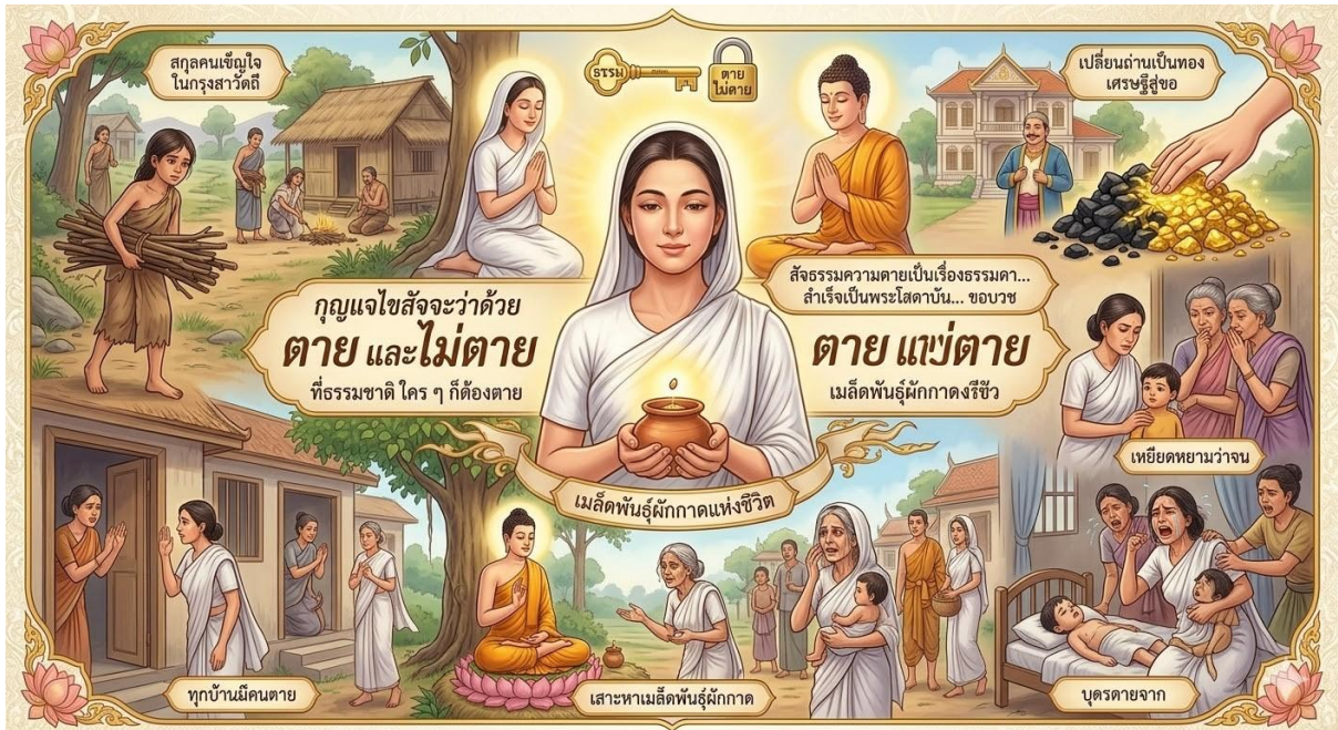
ภาพที่ 5 พระกีสาคโตมี กับการแสวงหาความจริงผ่านกุญแจความคิด ว่าด้วยเรื่องลูกตาย และเม리트 ผักกาดจากบ้านที่ไม่มีคนตาย (ภาพจำลองจาก AI, 9 มีนาคม 2569)

จากที่ยกกรณีตัวอย่างมาเป็นเพียงบางส่วน ซึ่งยังมีอีกหลายกรณีศึกษา หรือมีอีกหลายปัญหา ที่ต้องได้รับการแก้ไข หรือปรับเพื่อให้เกิดความถูกต้อง โดยปัญหาเหล่านั้นให้ใช้ปัญญาเข้าไปเป็นเครื่องมือเพื่อแก้ไข ดังที่เกิดขึ้นในครั้งพุทธกาล ผลจากเหตุการณ์ถูกเล่าส่งต่อมาเป็นชุดข้อมูล ความรู้ จนกระทั่งปัจจุบัน เรียกว่า กุญแจที่เป็นคำพูด (คำสอน) สู่กุญแจแห่งความคิดและนำไปสู่การสร้างปัญญา ลด บรรเทา ปัญหาที่จะเกิดขึ้นได้ ดังกรณีของการใช้คำว่า “เลือดกับน้ำอันไหนสำคัญกว่า” จึงเป็นที่มาของการยุติสงครามแย่งน้ำในกลุ่มของประยูรญาติที่กำลังยกพลเพื่อทำสงครามแย่งน้ำกัน (พระมหาหรรษา ธมฺมหาโส, 2553) หรือกรณีของพระเจ้าปเสนทิโกศล เลือดพ่อกับเลือดแม่อันไหนสำคัญกว่า (พระระพิน พุทธิสาร, 2555) หรือ พ่อเป็นกษัตริย์ ลูกจะเป็นกษัตริย์ด้วยหรือไม่ ปรับจิต ปรับวิจิต ทำให้เกิดทัศนคติใหม่ นำไปสู่การลดปัญหาความรุนแรงในครอบครัวลง เป็นต้น ดังที่ยกมาเป็นกรณีศึกษาดังปรากฏ