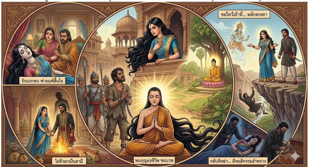
ภาพที่ 3 นางกุนทลเกสี กับการแสวงหาความจริงผ่านกุญแจความคิดและการบวช (ภาพจำลองจาก AI, 9 มีนาคม 2569)

พฤติกรรมฉ้อฉลเป็นปกติธุระ” โดยใช้ความไว้วางใจเชื่อใจจากความเป็นคนในครอบครัว ถ้าเป็นภาษาร่วมสมัยคือโกงคนในครอบครัว นางจึงใช้ปัญญา แก้ปัญหาอย่างมีวิมุติภาวะ โดยการอำพราง ว่าทรัพย์เหล่านี้เป็นของพี่อย่างไรเสียก็คนครอบครัวเดียวกัน พี่จะมาหาหนูเพื่อทรัพย์ทำไม แต่ถ้าพี่ไม่เชื่อ อยากรื้อเสียหนูขอไหว้ เจ้าที่อารักษ์ เสียก่อน จากนั้นเมื่อสามีเผลอ จึงผลักสามีโจรตกเขาตายไป แพลแบบศัพท์ร่วมสมัย นางก็ใช้สติปัญญาในการแก้ปัญหา โดยใช้เทคนิคการเจรจาต่อรอง จนกระทั่งผ่านปัญหาไปได้ และในที่สุดพบกุญแจชีวิตด้วยคำสอนของพระพุทธเจ้า และขอบวชเป็นนางภิกษุณีในที่สุด ดังพุทธพจน์ที่ พระพุทธเจ้าตรัสคาถาแก้ภิกษุทั้งหลาย ตามที่ปรากฏใน เรื่องพระกุนทลเกสีเถรี ที่ว่า “...ธรรมะบทหนึ่ง ที่คนฟังแล้วสงบระงับได้ ย่อมดีกว่าคาถาที่ไร้ประโยชน์ตั้ง ๑๐๐ คาถา...ผู้ชนะข้าศึกจำนวนพันคุณด้วยพันในสงคราม หาชื่อว่าผู้ชนะที่ยอดเยี่ยมไม่ แต่ผู้ชนะตนได้ จึงชื่อว่า ผู้ชนะที่ยอดเยี่ยม...” (ขุ.ธ. (ไทย) ๒๕/๑๐๒-๑๐๓/๖๒:พระกุนทลเกสีเถรีวัตถุ)