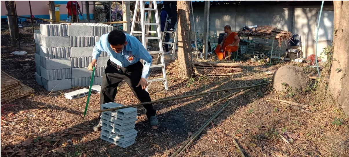
จัดเตรียมไม้ไผ่ทำโครงสร้างชั้นวางก้อนเห็ด