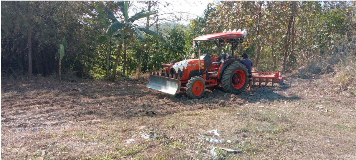
จัดเตรียมพื้นที่ทำแปลงปลูกผักบริเวณด้านหลังโรงเรียน