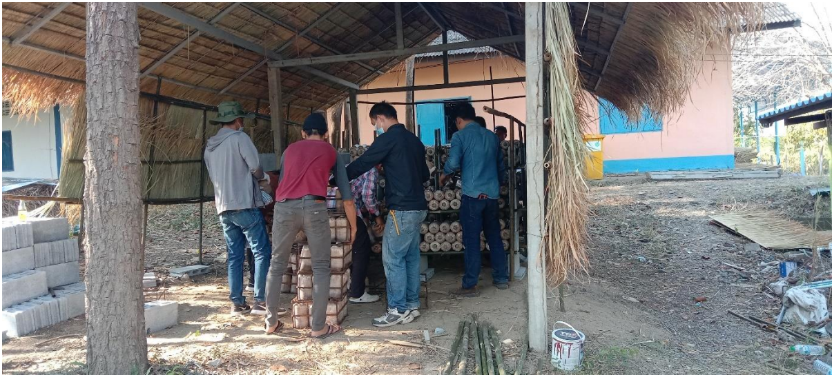
ก้อนเห็ดภูฐานล็อตแรก ๑,๓๐๐ ก้อน จากอุ้มทอง นำมาจัดเรียงในโรงเพาะเห็ด