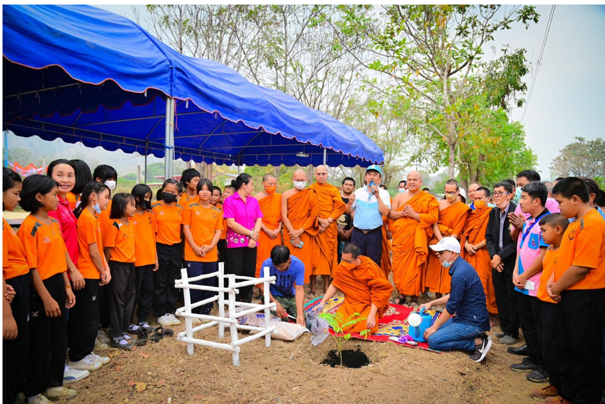
เจ้าคณะอำเภอต้านช้างมาเป็นประธานเปิดโครงการและปลูกต้นไม้เป็นที่ระลึก