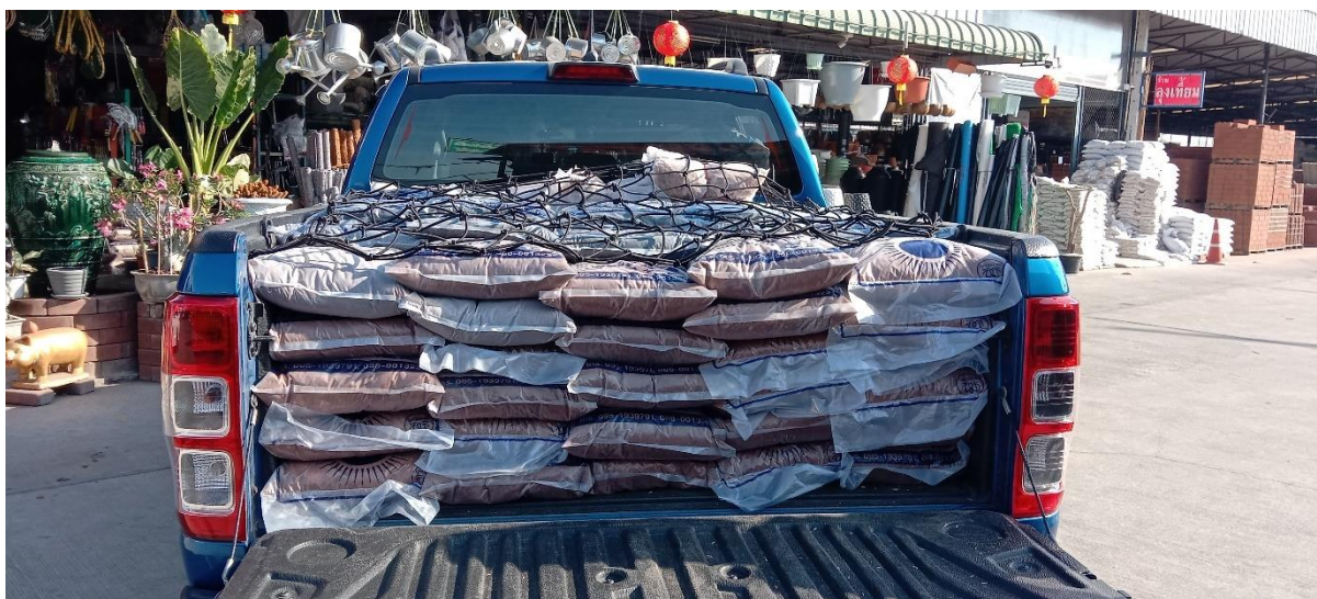
จัดซื้อดินก้ามปู, ขุยมะพร้าว, แกลบดำ สำหรับผสมดินปลูกผัก