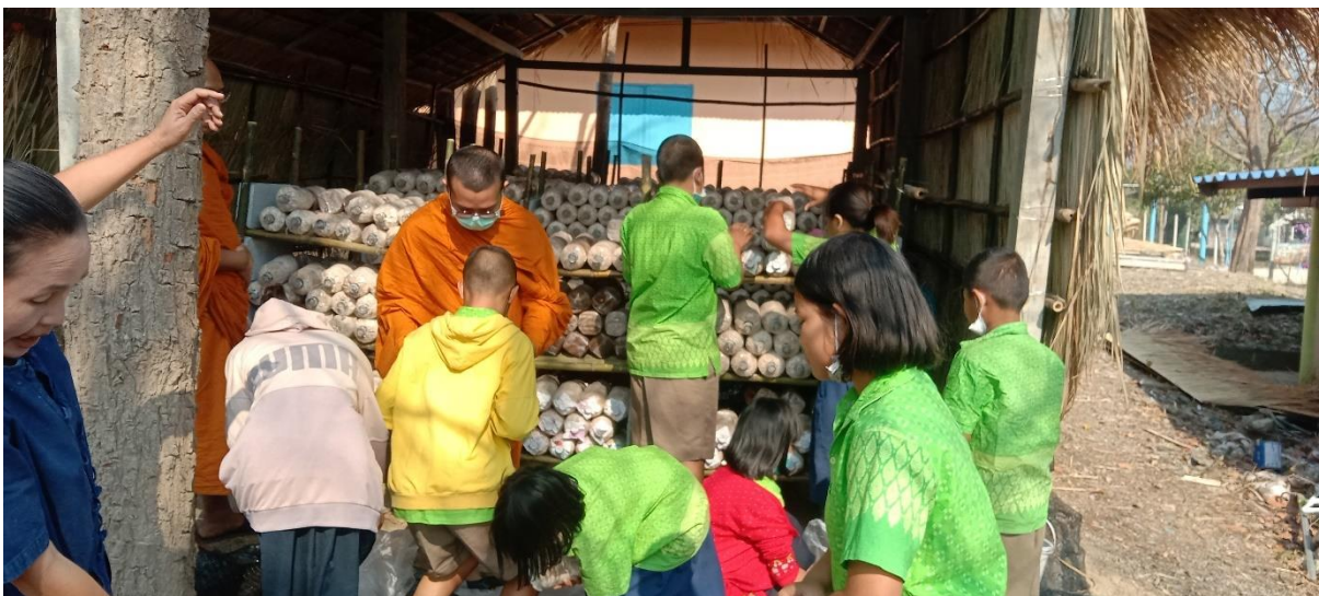
นักเรียนช่วยกันจัดก้อนเห็ดภูฐาน ๒๐๐ ก้อน ที่นำไปจากพระนครศรีอยุธยา วันที่ ๒๕ มกราคม ๒๕๖๖