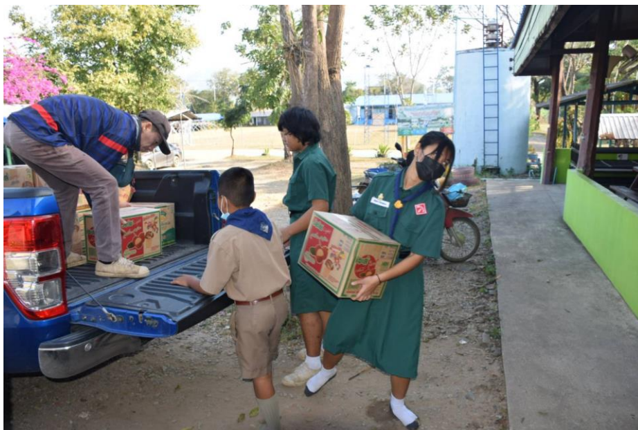
นำสิ่งของเครื่องอุปโภคและบริโภคที่มีเจ้าภาพร่วมบริจาคให้มานำไปส่งให้โรงเรียน