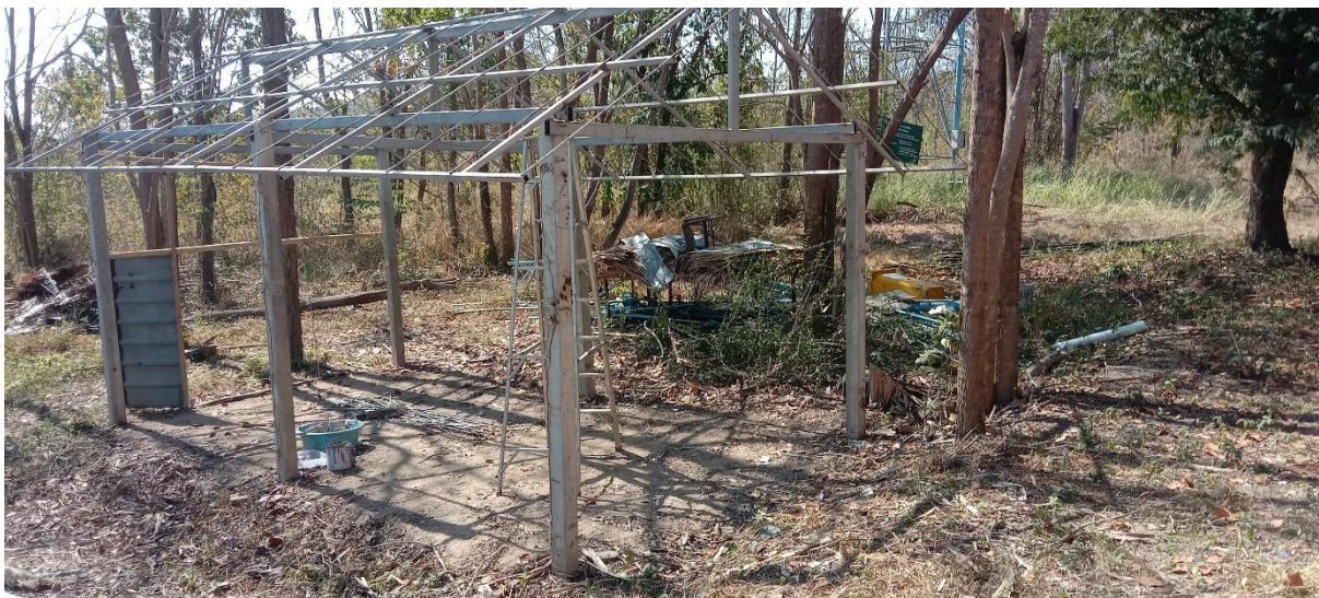
วางโครงสร้างโรงเรียนเพาะเห็ดภูฐานใหม่