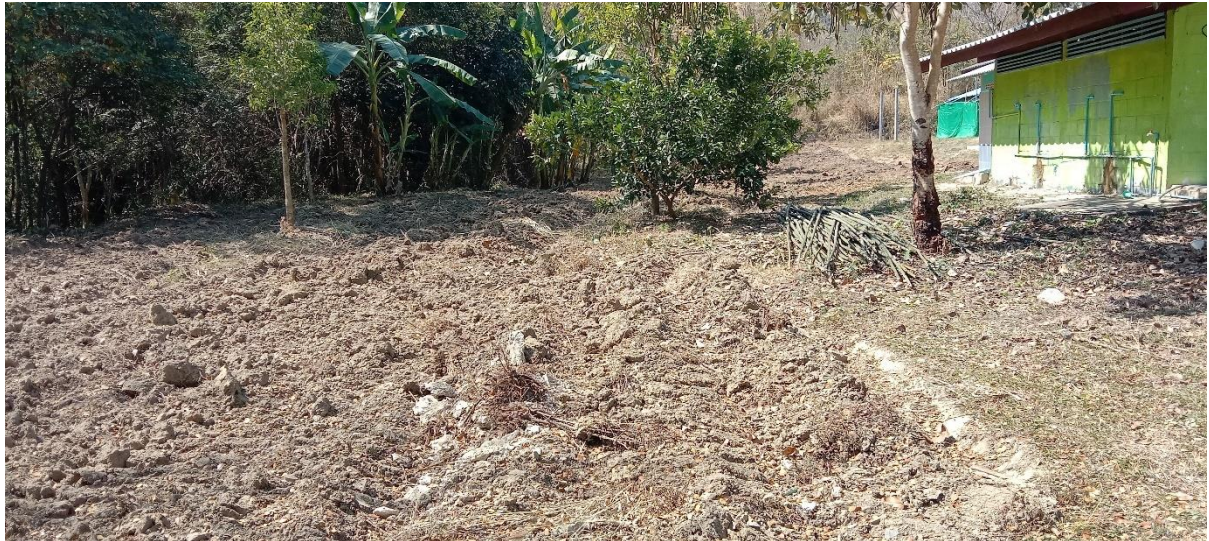
แปลงดินพร้อมที่รถไถได้ไถพรวนไว้แล้วพร้อมปลูก