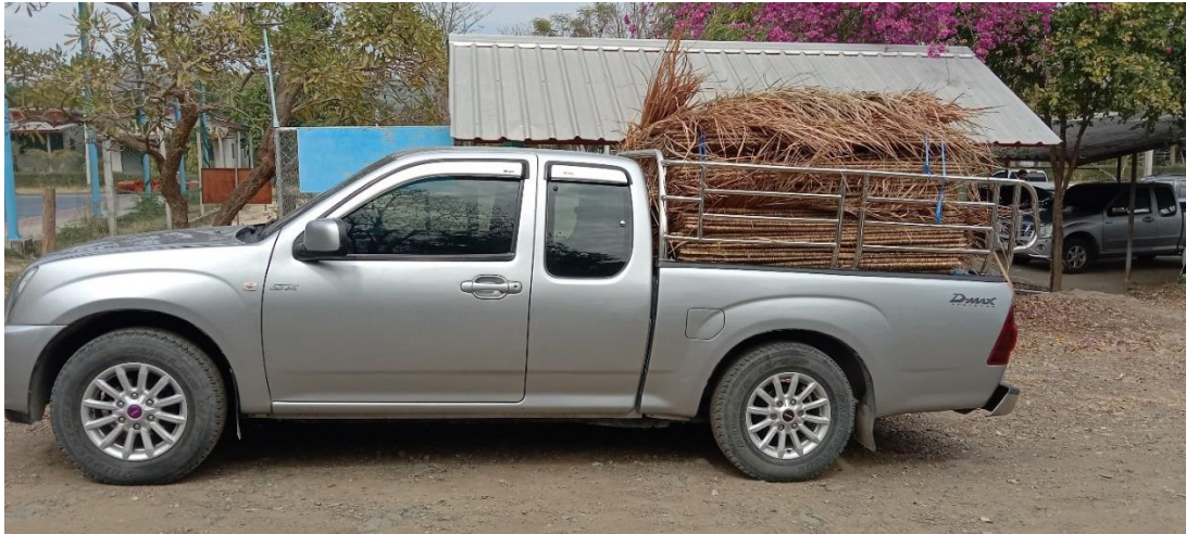
จัดซื้อหญ้าคามุงหลังคา จำนวน ๑๕๐ ตับ ตับละ ๒๐ บาท ครั้งที่ ๒ เมื่อ ๒๑ มกราคม ๒๕๖๖