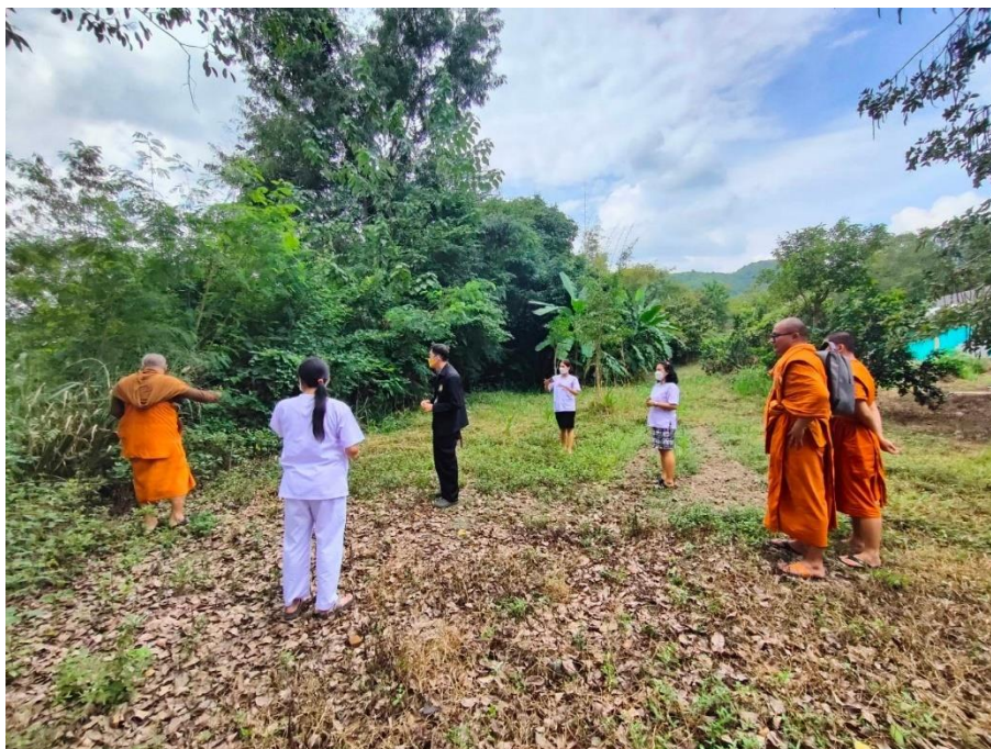
สำรวจพื้นที่ทำแปลงผัก