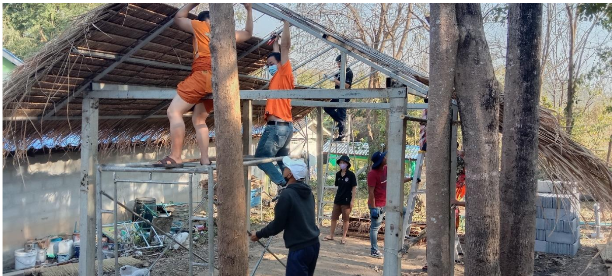
คณะจิตอาสาช่วยกันมุงหลังคา วันที่ ๒๑ มกราคม ๒๕๖๖