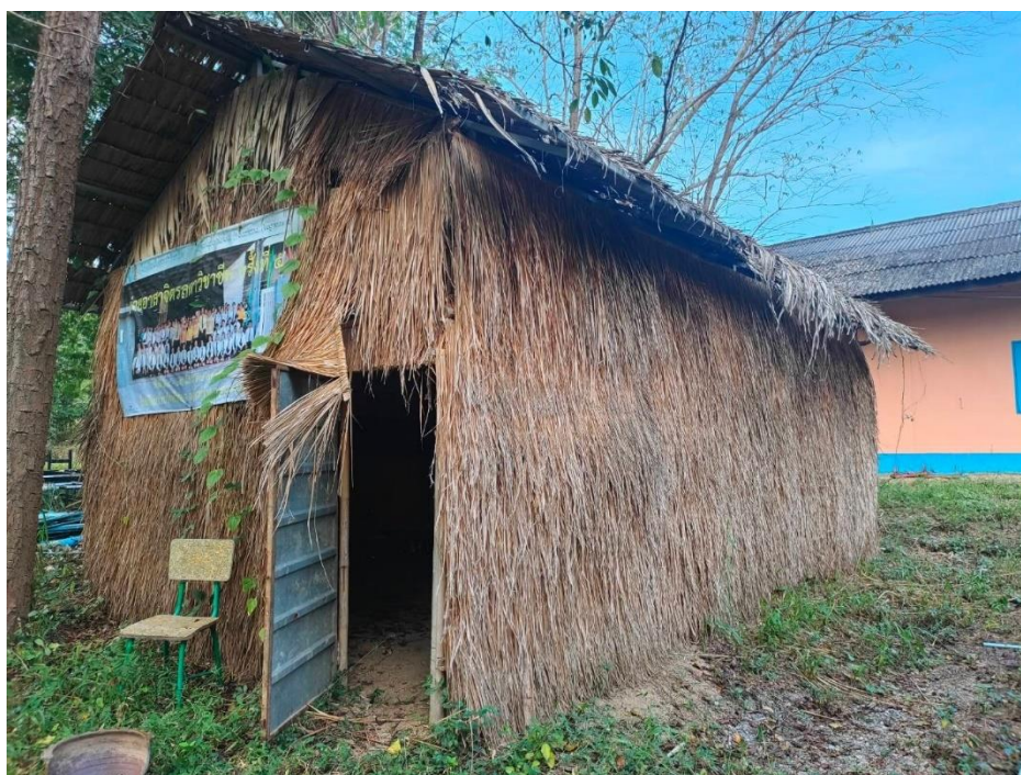
สำรวจพื้นที่ทำโรงเพาะเห็ดภูฐาน ๑,๕๐๐ ก้อน