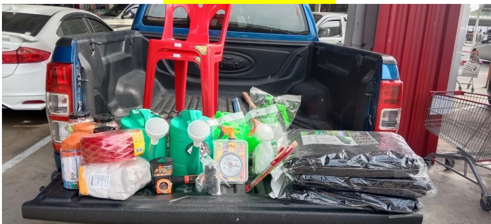
จัดซื้อวัสดุอุปกรณ์/เครื่องมือ จากไทวัสดุ