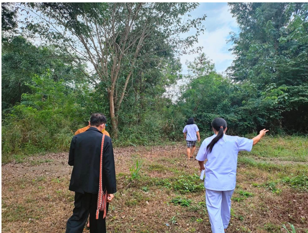
สำรวจพื้นที่จัดกิจกรรม