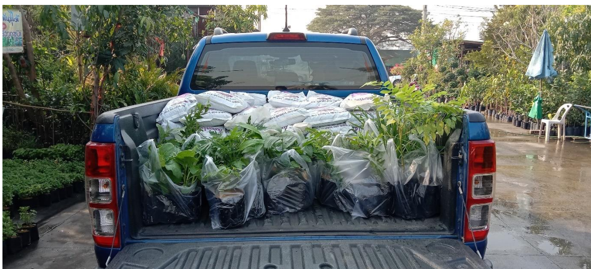
จัดหาพืชผักสวนครัวแบบพร้อมปลูก