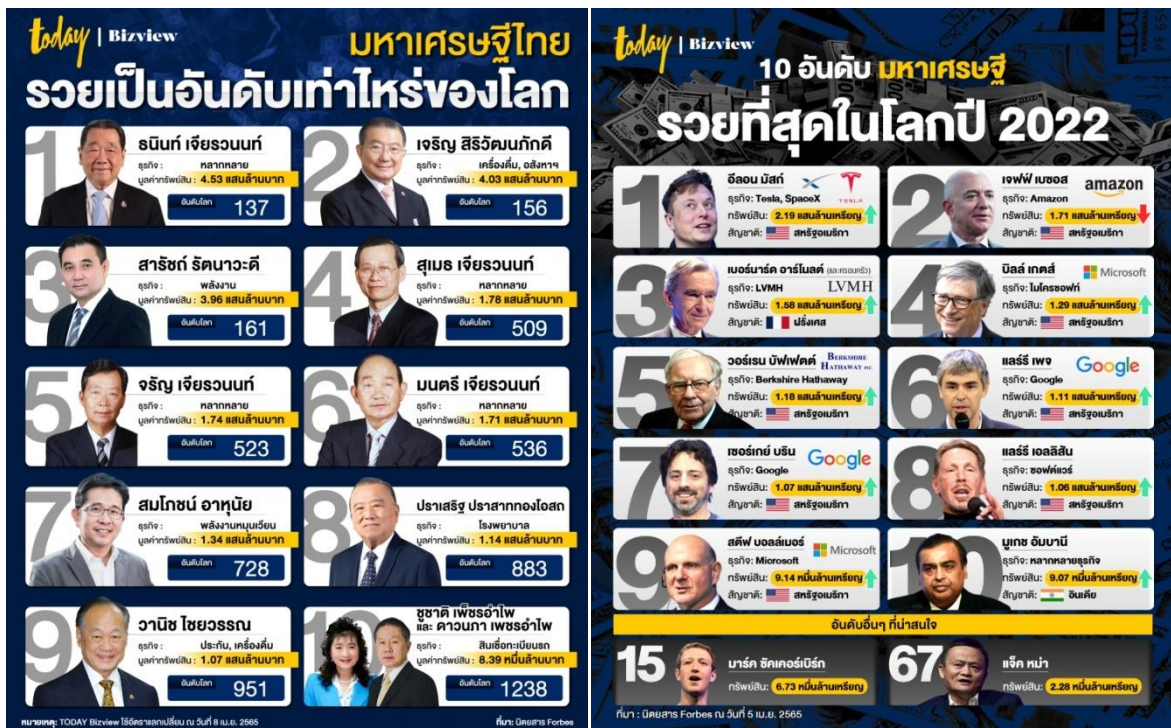
ภาพที่ 2 ความมั่งคั่งและความร่ำรวยของมหาเศรษฐีไทยและทั่วโลก

ทรัพย์สินสุทธิ (-) หมายถึง มีทรัพย์สินติดลบ ยิ่งหากทรัพย์สินติดลบ (-) จำนวนมากเท่าไรก็จะแสดงให้เห็นถึงความย่ำแย่และสถานะความมั่งคั่งลดลงเรื่อย ๆ