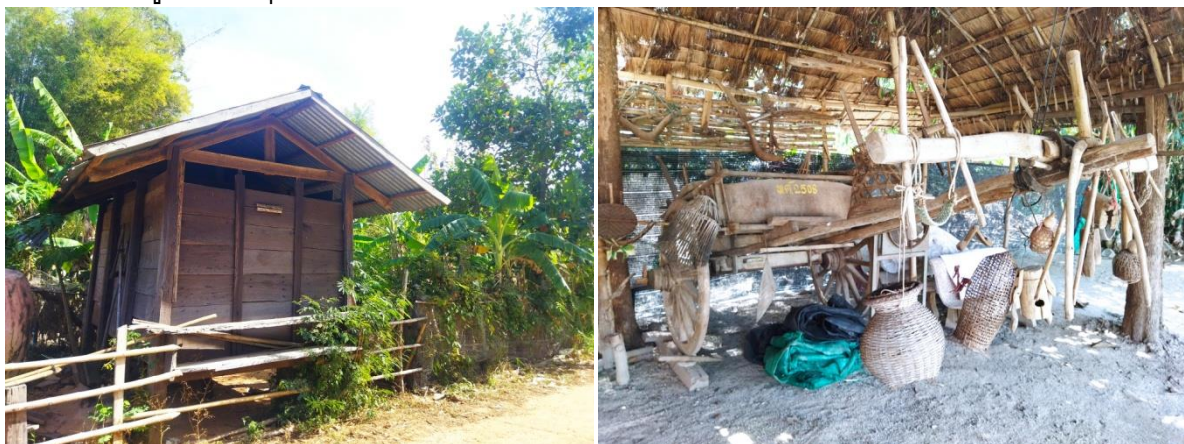
ภาพที่ 1 เล้าข้าวและเกวียนเครื่องมือสำคัญที่บ่งบอกความมั่งคั่ง ดัชนีชี้วัดความมั่งคั่ง

6. การสร้างเล้าข้าวจะไม่สร้างในลักษณะขวางตะวัน เพราะเชื่อว่าถ้าสร้างแล้วจะมีแต่สิ่งที่ขัดขวาง ไม่อยู่เย็นเป็นสุข