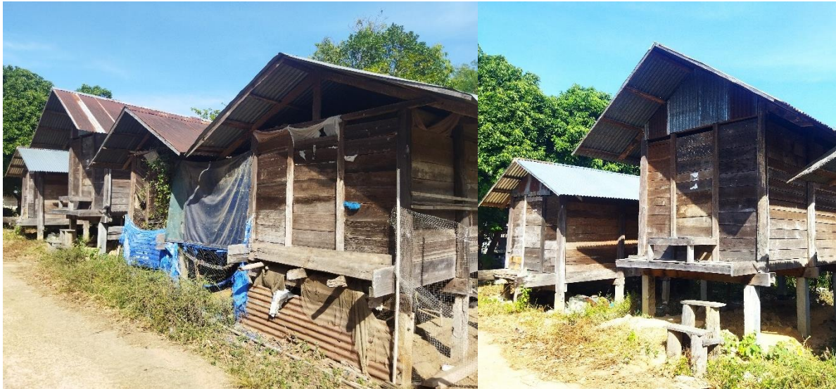
ภาพที่ 3 ขนาดของเล้าข้าวที่มีขนาดเล็กและขนาดใหญ่ แสดงถึงความมั่งคั่งและปริมาณข้าว