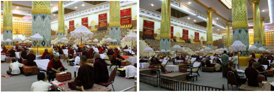
ภาพที่ ๕.๘ ภาพการสอบผู้ทรงพระไตรปิฎก ณ ถ้ำปาสาณ กรุงย่างกุ้ง (Maha Pathana Cave in Thiri Mingalar Kaba Aye Hill in Yangon) (เมื่อ ๑๐ มกราคม ๒๐๑๔/๒๕๕๘)

จนกระทั่งเมื่อวันที่ ๑๗ มิถุนายน พ.ศ. ๒๕๕๘/๒๐๑๖ สำนักงานประธานาธิบดีพม่า (the Office of the President of Myanmar) ได้ออกคำสั่งแก้ไขเพิ่มเติมระบบสมณศักดิ์ของพระสงฆ์พม่าเพิ่มเติมจากที่มีอยู่เดิมเป็น ๗ หมวด ดังนี้