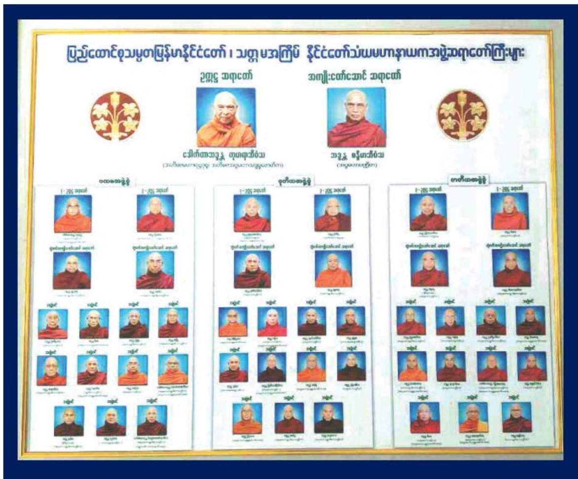
ภาพที่ ๕.๑ ภาพโครงสร้างการบริหารคณะสงฆ์ในประเทศเมียนมาร์