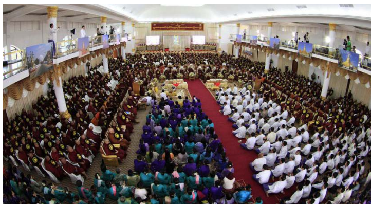
ภาพที่ ๕.๓ ภาพเหตุการณ์ประชุมสงฆ์นิกายกว่า ๑ พันรูป พร้อมศาสนิกผู้นับถือ ที่วัด Dhammaduta Zetawon Tawya Monastery ในกรุงย่างกุ้ง ในเดือนกุมภาพันธ์ ค.ศ.๒๐๑๒