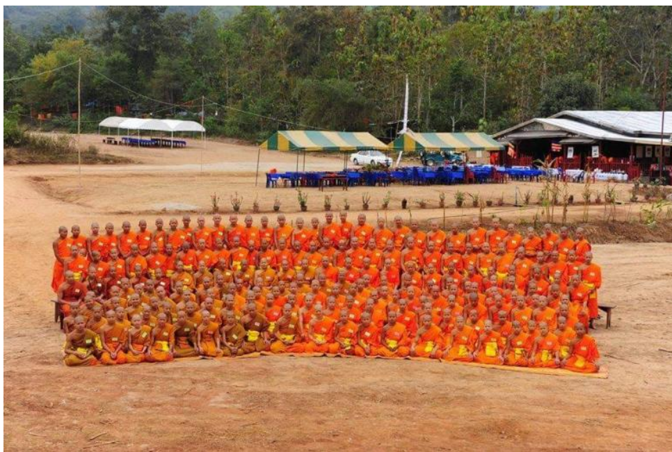
ภาพที่ ๔.๔ พระหนุ่มสามเณรน้อย ในนามนักเรียนโรงเรียนมัธยมสงฆ์ วัดภูควาย

“...โรงเรียนแห่งนี้สอนระดับมัธยมศึกษาตอนต้น ม.๑ – ม. ๔ ที่นี้มีครูอยู่ ๑๑ ท่าน เป็นทั้งฆราวาสและพระสงฆ์ และมีนักเรียนสามเณรประมาณ ๙๐ รูป ถือว่าเป็นโรงเรียนสงฆ์ขนาดเล็กในเมืองแก่นท้าว โรงเรียนยังขาดแคลนอุปกรณ์การเรียน สภาพโรงเรียนเป็นตึกหลังเดียว สองชั้น ปรับปรุงจากกุฏิสงฆ์มาเป็นโรงเรียน จากการสังเกตห้องเรียนชั้นล่างของชั้น ม. ๓ เป็นพื้นที่เก็บของที่ใช้เป็นห้องเรียน การสอนของครูฆราวาสผู้สอนใช้การบรรยายให้นักเรียนสามเณรจดตามที่ตนสอน โรงเรียนสงฆ์แห่งนี้เป็นโรงเรียนอยู่ภายใต้การดูแลของกระทรวงศึกษาธิการ เป็นหลักสูตรโรงเรียนปริยัติธรรมสามัญ คือ การผสมผสานทั้งเรียนธรรมและเรียนฝ่ายสามัญด้วย จบการศึกษาออกมาสามารถไปเรียนต่อยังสถาบันที่สูงขึ้นทุกแห่งเหมือนการศึกษาของรัฐอื่นทั่วไป ส่วนใหญ่ของสามเณรมาจากชนบทห่างไกลมาอาศัยตามวัดต่างๆในเมืองแก่นท้าวไม่ได้ประจำอยู่วัดนี้แห่งเดียว เณรจะกระจายตามวัดต่างๆ เพราะวัดที่มีโรงเรียนไม่สามารถรองรับจำนวนสามเณรได้ทั้งหมด”