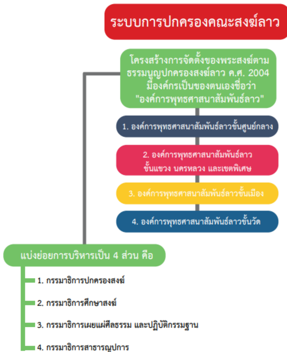
ภาพที่ ๔.๑ โครงสร้างการบริการคณะสงฆ์ในประเทศลาว

ผัก เลี้ยงหมู และห้ามมีการบรรพชาอุปสมบท ทำให้จำนวนพระภิกษุสามเณรลดลงมาก แม้แต่สมเด็จพระสังฆราชของลาวยังต้องหลบหนีไปอยู่ประเทศไทยและได้มรณภาพที่นี่ ๑๑