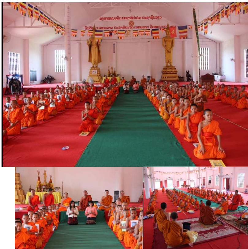
ภาพที่ ๔.๕ ผู้บริหารและนักเรียนการศึกษาสงฆ์ของลาวที่หลวงพระบาง วัดภูควาย