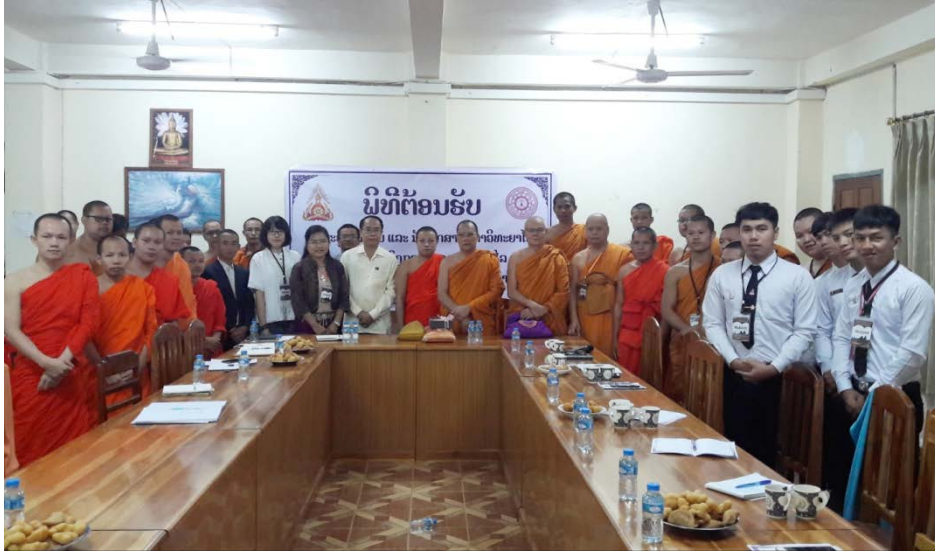
ภาพที่ ๔.๖ มหาวิทยาลัยมหาจุฬาลงกรณราชวิทยาลัย วิทยาเขตอุบลราชธานี แลกเปลี่ยนเรียนรู้ ร่วมกับผู้บริหาร นิสิตวิทยาลัยสงฆ์ปากเซ ณ อาคารวิทยาลัยสงฆ์ วัดหลวงปากเซ จำปาสัก (ที่มา: ๓ กันยายน ๒๕๖๑)