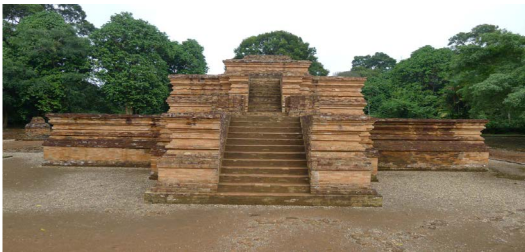
ภาพที่ ๘.๓ พุทธสถานมูอาราจัมบี (Muarajambi) กับพระพุทธรูปในอินโดนีเซีย

มูอาราจัมบี (Muarajambi) เป็นพุทธสถานโบราณที่สร้างขึ้นในยุคศรีวิชัย ตั้งอยู่ในเขตเมืองจัมบี (Jambi) บนเกาะสุมาตรา ประเทศอินโดนีเซีย เมื่อมีการค้นพบสถานที่แห่งนี้ ทางราชการได้อพยพชาวบ้านที่อาศัยอยู่บนพื้นที่ออกไปและจัดพื้นที่ทำกินให้ใหม่ หลังจากนั้นจึงมีโครงการฟื้นฟูสภาพจากซากปรักหักพังให้เป็นพื้นที่อนุรักษ์ทางประวัติศาสตร์ เมื่อได้ศึกษาค้นคว้าหลักฐานทางประวัติศาสตร์จากเอกสารและวัตถุต่างๆ แล้ว พอจะสันนิษฐานได้ว่าพุทธสถานแห่งนี้มีความเก่าแก่ประมาณหนึ่งพันห้าร้อยปี เป็นช่วงที่พุทธศาสนาเผยแผ่เข้ามาในถิ่นนี้ในยุคอาณาจักรศรีวิชัย ซึ่งกินพื้นที่กว้างไกลรวมไปถึงเกาะชวาและเกาะบาหลี ตลอดจนแผ่อิทธิพลขึ้นไปทางภาคใต้ของสุวรรณภูมิที่เมืองไชยา จังหวัดสุราษฎร์ธานี สภาพของพุทธสถานแห่งนี้ทรุดโทรมเหลือเพียงซากกองอิฐกระจายเป็นจุด ๆ เมื่อทำการขุดค้นในพื้นที่ที่กำหนดรูปแบบเขตพื้นที่การก่อสร้างได้ จึงได้ฟื้นฟูพื้นที่โดยนำซากอิฐเดิมมาปรับแต่งก่อสร้างโครงสร้างส่วนฐานของพุทธสถานนี้ เพื่อประโยชน์ในการศึกษาและเป็นสถานที่ท่องเที่ยวเชิงอนุรักษ์ของท้องถิ่น