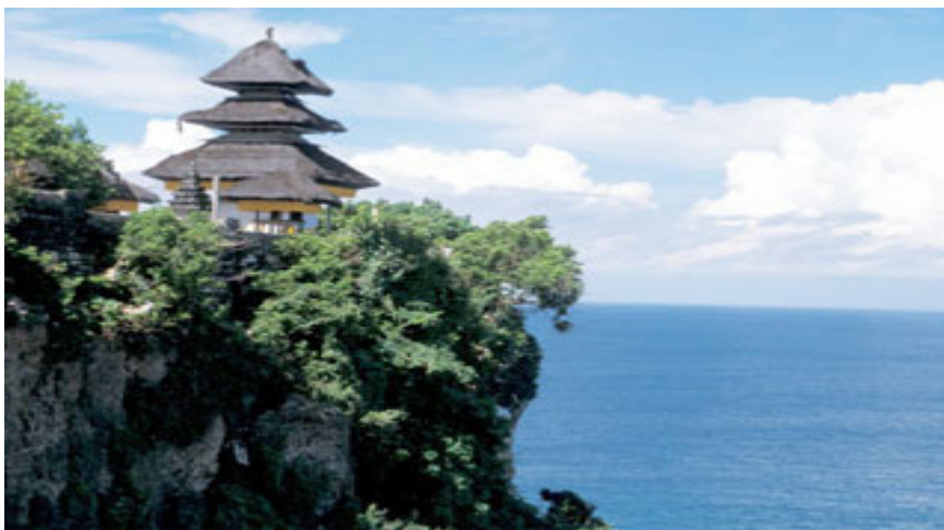
ภาพที่ ๘.๕. วัดปุรา อุลัน ดานู บาตุร์ (Pura Ulan Danu Batur)

วัดปุรา อุลัน ดานู บาตุร์ (Pura Ulan Danu Batur) หรือวัดอุลัน ดานู บาตุร์ ซึ่งเป็นวัดใหญ่ที่ถือได้ว่าสำคัญเป็นอันดับ ๒ รองจากวัดเบซิกิห์ วัดแห่งนี้มีขนาดใหญ่โตและงดงาม คล้ายศิลปะแบบเดียวกับ นครวัด นครธม วัดแห่งนี้ตั้งอยู่บนหน้าผามีความสูง ๒๕๐ เมตร ทางคาบสมุทรตอนใต้ของเกาะซึ่งทอดตัวไปในมหาสมุทรอินเดีย วัดแห่งนี้ได้มีการสร้างขึ้นในศตวรรษที่ ๑๐ ประตูป่าซิก หรือ จันดี เป็นตารุ ของวัดนี้ด้านข้างสลักเป็นลักษณะของปีก ส่วนทางเข้าสู่ลานวัดชั้นที่สอง ประจายามโดยรูปปั้นพระพิฆเนศเศียรช้างที่ผู้คนนับถือว่าเป็นเทพผู้ปัดเป่า อุปสรรค สถานชั้นในสุดอันศักดิ์สิทธิ์ หรือ เจโรอัน นั้นได้เฉพาะผู้ที่สวดบูชาเพื่อเทพแห่งท้องทะเลวัดแห่งนี้เป็นหนึ่งในวัดสำคัญของเกาะบาหลีซึ่งปกป้องอันตรายจากภูตผี ต่างๆ เป็นศิลปะสถาปัตยกรรมการสร้างด้วยหินสีดำและการออกแบบที่สวยงาม เช่นเดียวกับวัดอื่นๆ บริเวณหลังวัด จะมองเห็นทั้งทะเลสาบบาตุร์ และภูเขาไฟกุนุงบาตุร์