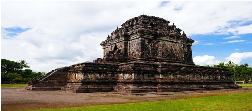
ภาพที่ ๘.๒ มหาวิหารของชาวพุทธพระวิหารเมนดุต

ศาสนamahayan ชั้นหลังคาประดับด้วยเรือนธาตุจำลองซ้อนชั้นตามแบบวิมานอินเดียได้ แต่ประดับไปด้วย สลุปิกะตามแบบชวาภาคกลางแล้ว ซึ่งการเปลี่ยนแปลงนี้คงได้อิทธิพลมาจากพุทธศาสนาเป็นสำคัญ