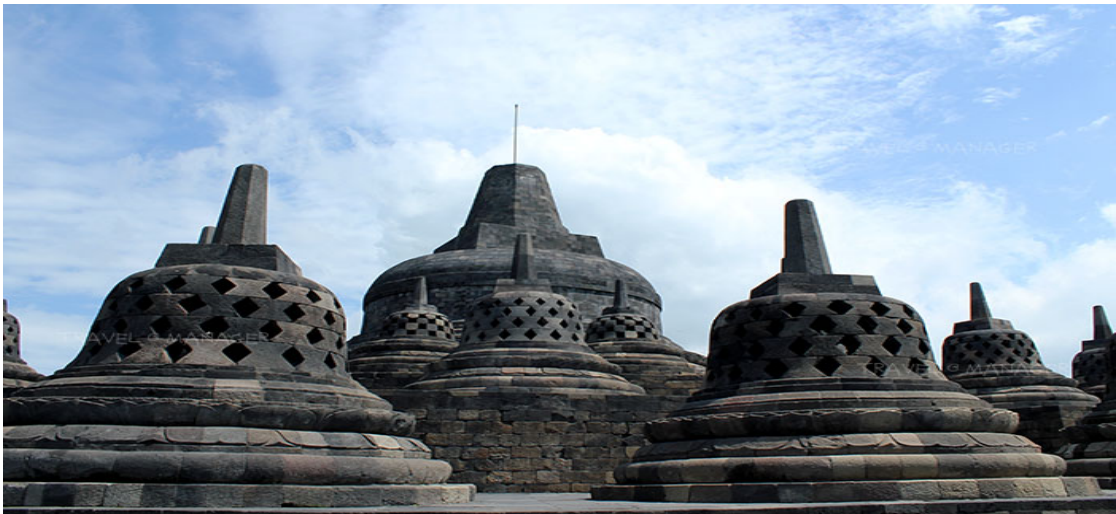
ภาพที่ ๘.๑ โบราณสถานบุโรพุทโธ ในประเทศอินโดนีเซีย

วงกลม สามวงกลมยอดโดมกลางและบนลานกลมชั้นสูงสุดมีพระสถูปตั้งสูงขึ้นไปอีก ๓๑.๕ เมตร เป็นมหาสถูปที่ระเบียงซ้อนกันเป็นชั้น ๆ ลดหลั่นกันไป มหาสถูปมีการตกแต่งด้วยภาพสลัก ๒๖๗๒ ชิ้น และ รูปปั้นพระพุทธรูป ๕๐๔ องค์ โดมกลางล้อมรอบด้วย ๗๒ รูปปั้นพระพุทธรูปแต่ละนั่งองค์อยู่ภายในสถูปเจาะรูปลี่เหลี่ยมข้าวหลามตัด ที่รอบล้อมสถูปด้านบนสุด ในชั้นบนสุดของบุโรพุทโธ ที่ถือว่าเป็นส่วนยอดสุดของวิหาร มีลักษณะเป็นฐานวงกลมใหญ่ของเจดีย์องค์ประธาน เวลาที่มองมาจากที่ไกล จะเห็นเป็นเหมือนดอกบัวขนาดใหญ่ ตั้งตระหง่านอยู่กลางหุบเขา ไม่พบภาพสลักใด ๆ ปรากฏอยู่เหมือนพ้นจากความต้องการทุกสิ่งทุกอย่าง มีผู้อยู่มาภาพที่ปรากฏนี้ว่า แสดงถึงการหลุดพ้นจากทุกสรรพสิ่งในโลก หรือที่เรียกว่านิพพาน อันเป็นจุดหมายสูงสุดของศาสนาพุทธ