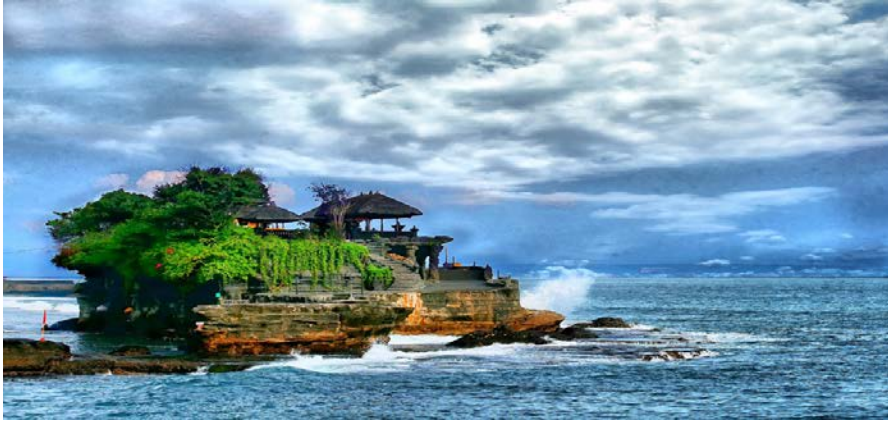
ภาพที่ ๘.๖ วิหารรุ่งหรือวิหารทานาห์ลอต